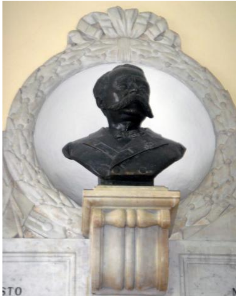
2) Dettaglio del busto