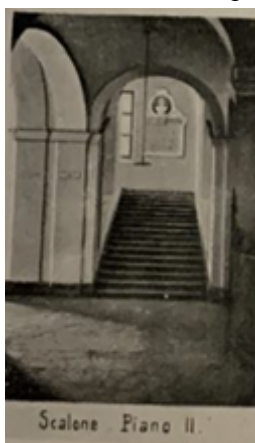
4) Riproduzione dello scalone lungo il quale è collocato l'omaggio a Langlois