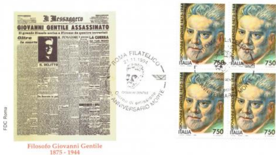
FIG. 3 - First day cover, emittente Roma, annullo filatelico Roma, non viaggiata. CpB