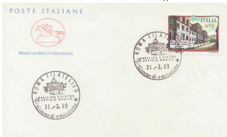
FIG. 2 - Cavallino, emittente Poste italiane, annullo filatelico primo giorno Roma, non viaggiato. CpB