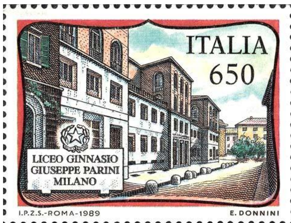
FIG. 1 - Francobollo celebrativo del Liceo Ginnasio Giuseppe Parini di Milano