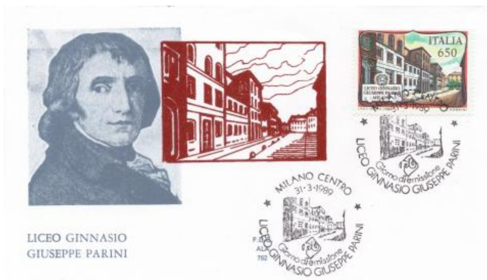
FIG. 3 - First day cover, emittente ALA, annullo filatelico primo giorno Milano centro, non viaggiata. CpB