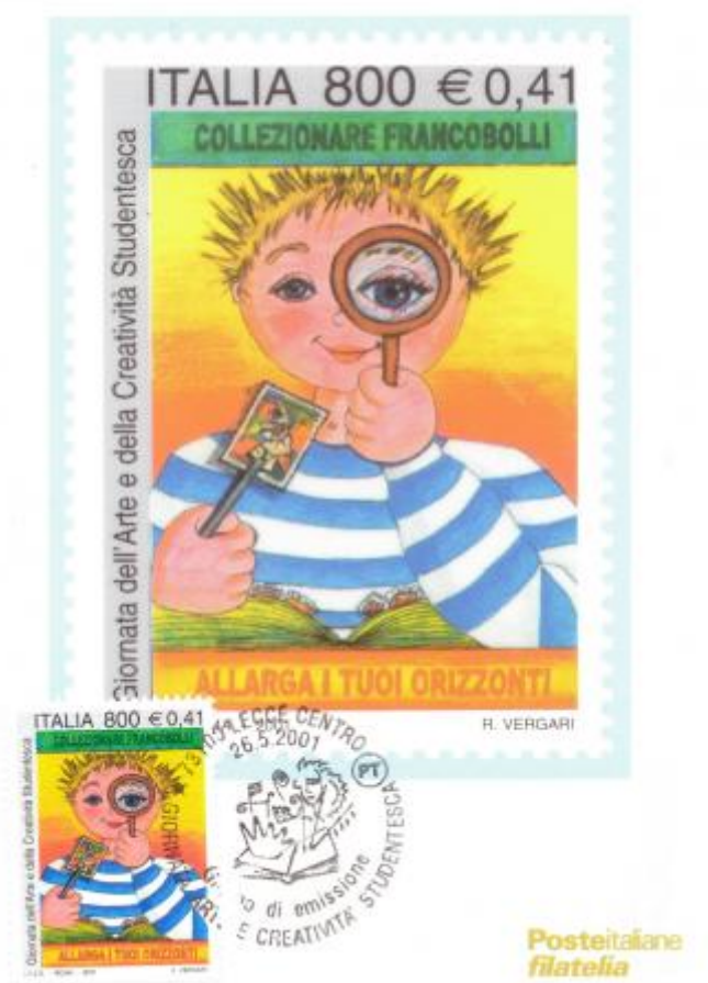
FIG. 4 - Maximum card, emittente Poste italiane, annullo filatelico primo giorno Lecce centro, non viaggiata. CpB