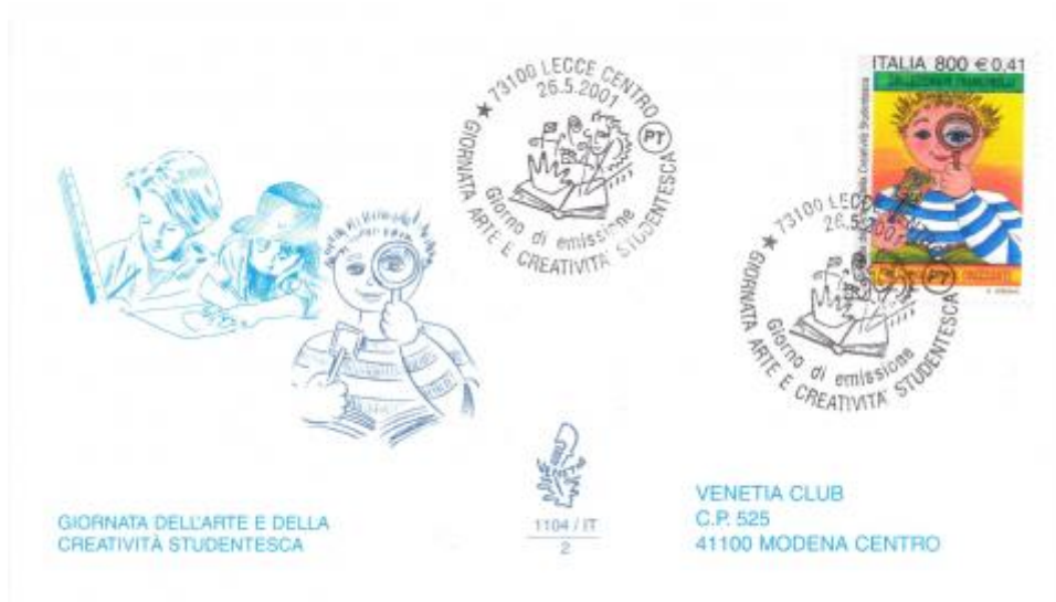
FIG. 3 - First day cover, emittente Venetia, annullo filatelico primo giorno Lecce centro, viaggiata. CpB