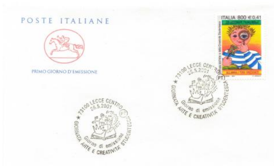
FIG. 2 - Cavallino, emittente Poste italiane, annullo filatelico primo giorno Lecce centro, non viaggiato. CpB