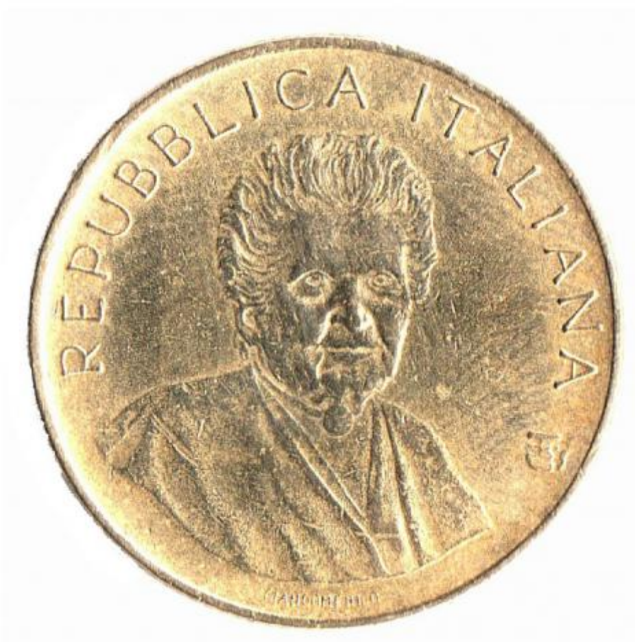
1) Foto del diritto della moneta commemorativa di Maria Montessori (ritaglio dell'originale)